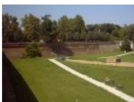
mura e sottomura